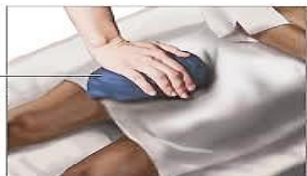
Sandbag applied to procedure site

– هنگامی که آنژیوگرافی پایان می یابد، لوله بلند از طریق کشاله ران یا مچ دست خارج شده و محل آنژیوگرافی به مدت کوتاهی تحت فشار قرار می گیرد.